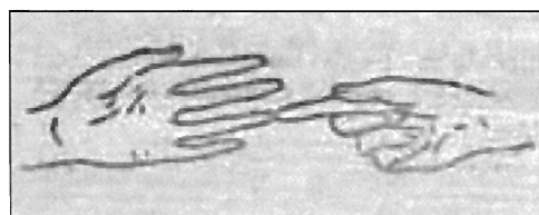
Mà pentagrama. / Mano pentagrama

Muchos de estos procedimientos son comunes a varias metodologías. Kodaly usa también una determinada forma de fononimia y muchos de estos procedimientos se usaban ya en la Edad Media. Todo ello, lejos de restar validez a las «analogías», debería ser garantía de su eficacia.